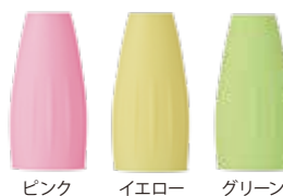
ピンク イエロー グリーン