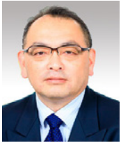
二瓶 智太郎 教授