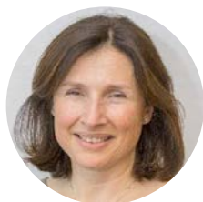
ドクターフランク