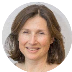
ドクターフランカ