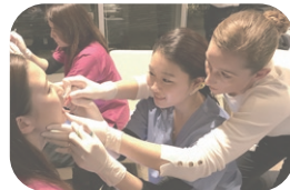
Touch to Teach の実習風景