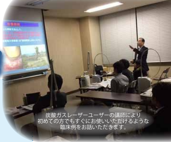
炭酸ガスレーザーユーザーの講師により初めての方でもすぐにお使いいただけるような臨床例をお話いただけます。

レーザーを診療に導入するうえで必要な基礎知識や安全面での対策、レーザーの照射方法・注意点など保険でできる活用術を中心にさせていただきます。